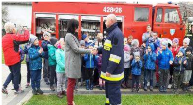
Święto Pieczonego Ziemniaka.