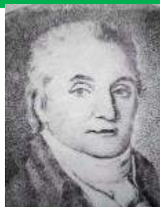
MAZUREK DĄBROWSKIEGO HYMN NARODOWY